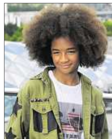
Dem Vater aus dem Gesicht geschnitten: Jaden Smith.

Will Smith war als rappender «Prinz von Bel-Air» (1990 bis 1996) bekannt geworden. Er mauserte sich gemäss dem Magazin «Forbes» zum «gewinnträchtigsten Filmstar des Jahres 2008».